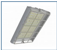
Решётка защитная Unit/Angar D60